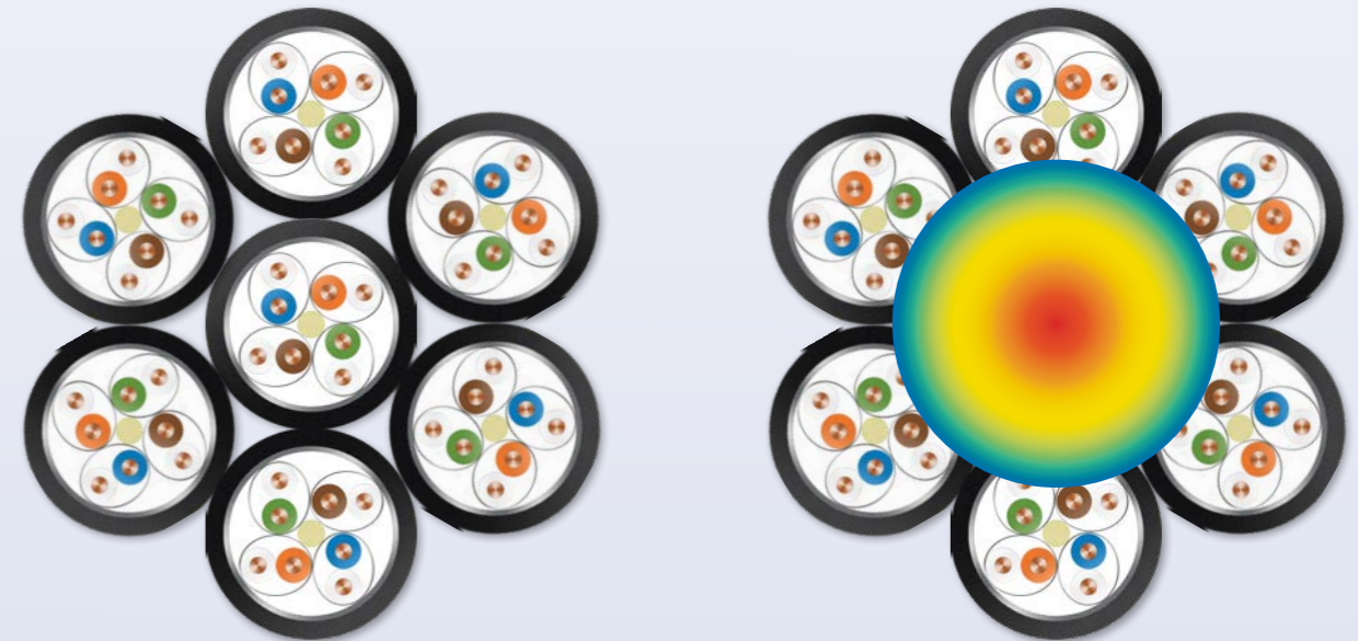
Anwendungsbeispiel für ein Ethernetkabelbündel mit PoE-Nutzung mit dabei entstehender Wärmeentwicklung

Die richtige Kabelkonstruktion leistet einen entscheidenden Beitrag bei der Minimierung der Kabelerwärmung.